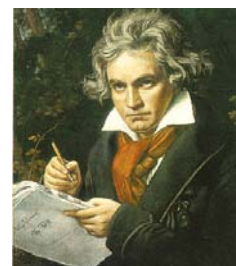
L. von Beethoven